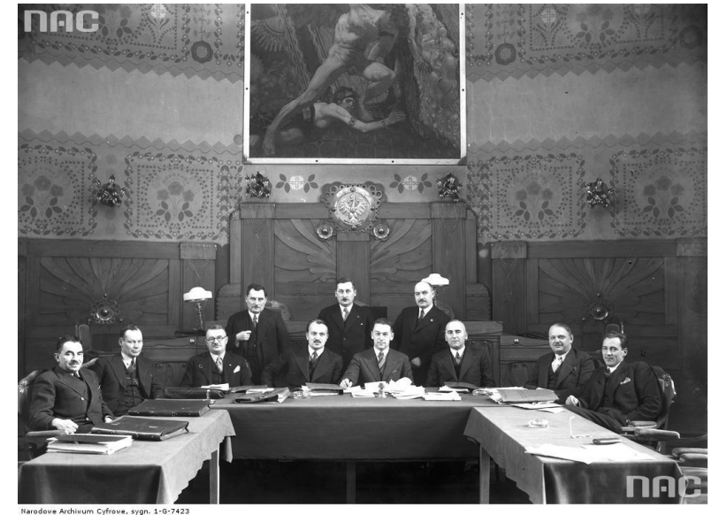
sygn. 1-G-7423