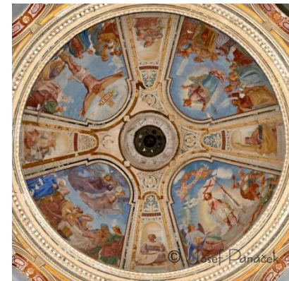
Hrobka rodiny Kleinů