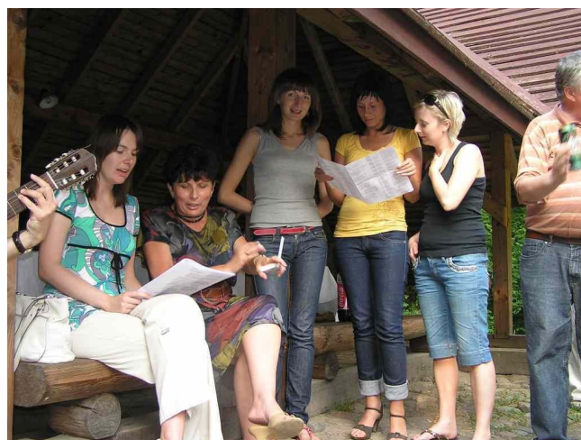
Koleżanki w ŁUW zasiliły chór- śpiewały super