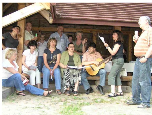
Ach co to był za chór