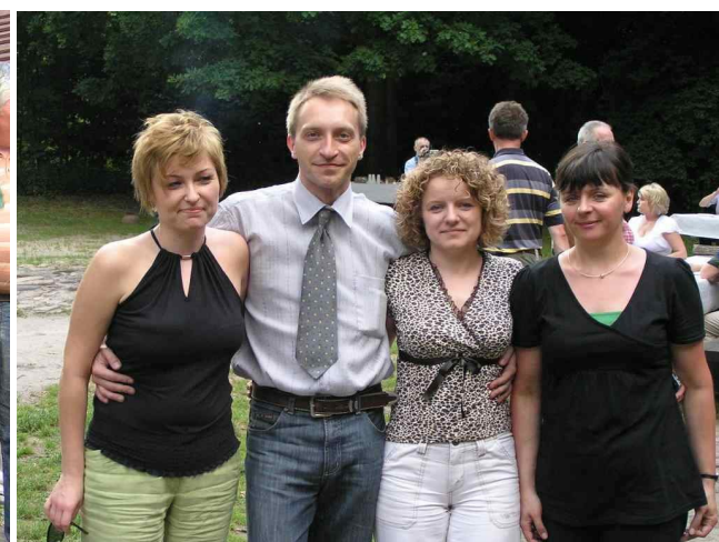
Nasze koleżanki i koledzy z M O D G i K