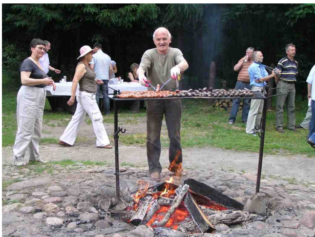
Już cieknie ślinka .....

W dniach 1 października 2007 roku , 9 czerwca 2008 roku i 29 maja 2009 roku zorganizowano „SPOTKANIA przy ognisku ” w Lesie Łagiewnickim w siedzibie Leśnictwa Miejskiego Łódź przy ulicy Łagiewnickiej 305 . Spotkania cieszyły się dużym zainteresowaniem i prawie zawsze dopisywała pogoda . Jeśli pogoda zawiodła - to dopisywały humory.