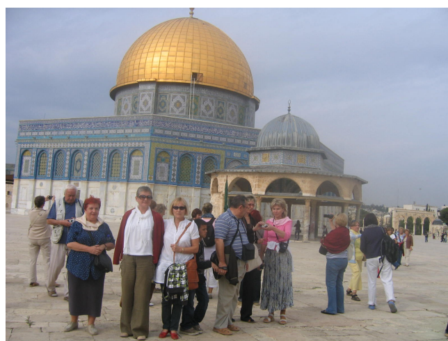
Wzgórze Świątynne w Jerozolimie