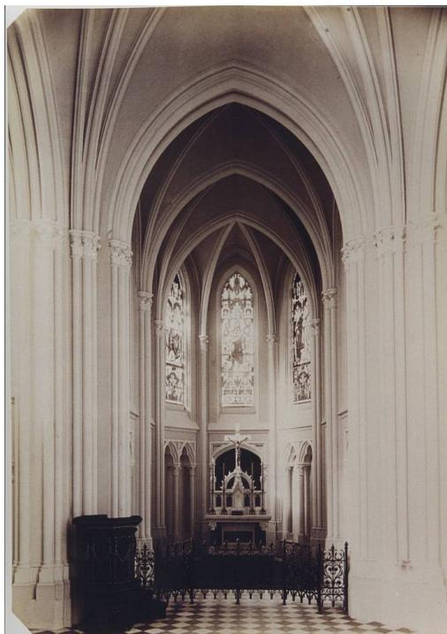
Wnętrze kaplicy- fot. archiwalna

W warszawskiej prasie pisano „ kaplica jest pomnikiem najkosztowniej wykonanym w kraju naszym ”, gdzie indziej zaś stwierdzono „ jest to niepospolite dzieło architektury, zaprojektowane z wielkim smakiem i wykonane z niezwykłą starannością ”.