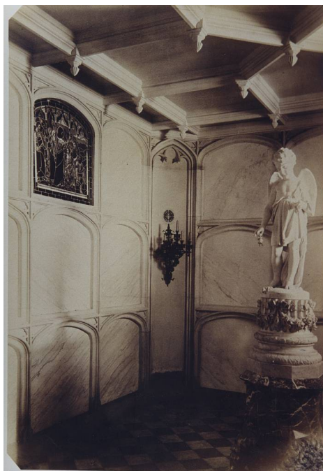
Wnętrze krypty – fot. archiwalna

Pamięć o przeszłości jest jednym z wyznaczników poziomu kultury każdego społeczeństwa. Oznacza to także opiekę nad budowlami będącymi pamiątkami historii. Świadomość tego leżała u podstaw inicjatywy stworzenia Fundacji.