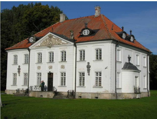
Choroszcz - Pałac Branickich