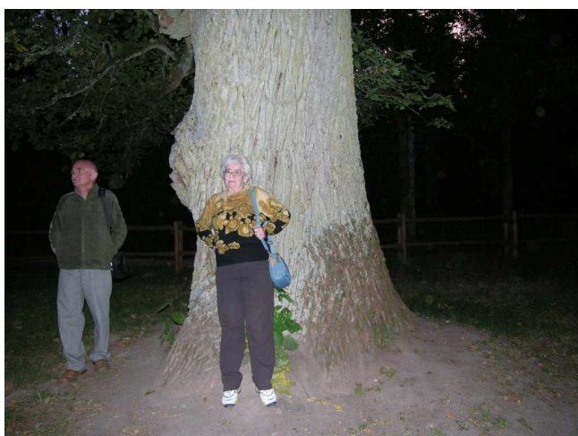
Białowieża - szlak dębów królewskich