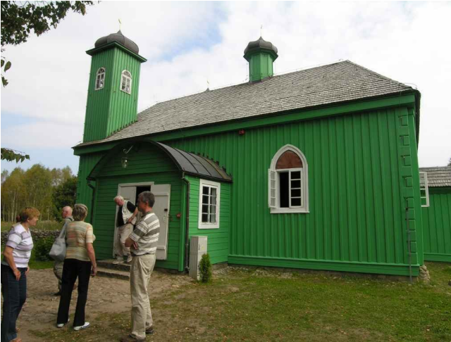
Kruszyniany - Meczet