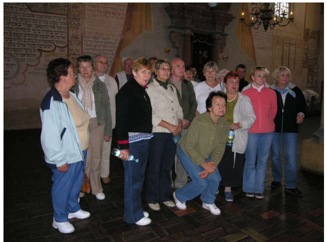
Muzeum w Tykocinie - Synagoga wewnątrz