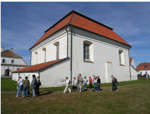
Muzeum w Tykocinie - Synagoga