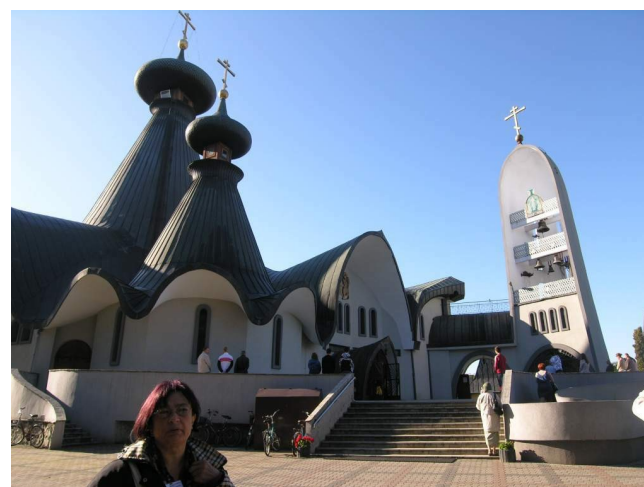
Hajnówka - Sobór Świętej Trójcy