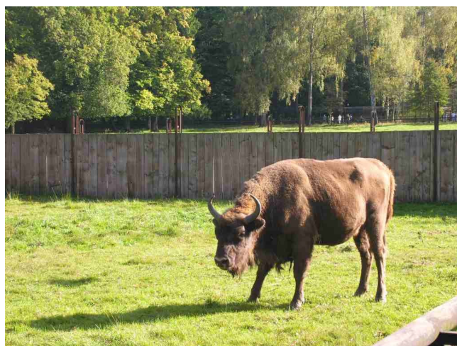
Żubr - symbol Parku Narodowego