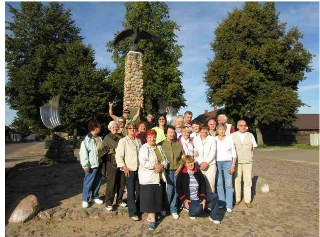
Pomnik - Order Orła Białego Ustanowił August II na Zamku Tykocińskim dnia 1.listopada 1705 r.