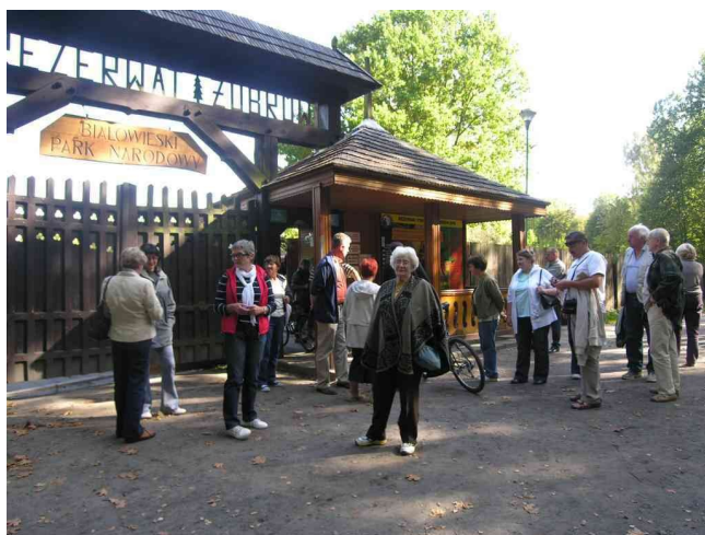
Białowieża - Park Narodowy

W dniach 19 - 22 września 2009 r. zorganizowano wycieczkę turystyczną do BIAŁEGOSTOKU i BIAŁOWIEŻY "SZLAKIEM CZTERECH KULTUR" odwiedziliśmy takie miejscowości a jak: Białowieża ( rezerwat pokazowy, muzeum, szlak dębów królewskich ) - Hajnówka ( sobór ) - Grabarka ( Święta Góra Prawosławia ) - Białystok - Siemiatycze - Drohiczyn - Ciechanowiec - Supraśl - ( zespół pałacowy i monastyr.) - Kruszyniany ( szlak tatarski i obiad regionalny w kuchni tatarskiej) - Krynki - Bohoniki - Choroszcz (pałacyk Branickich) - Tykocin Biebrzański ( synagoga, kościół ) Spotkaliśmy się również z kolegami z Oddziału Białostockiego SGP. W wycieczce wzięło udział 21 osób. Pogoda dopisała , było słonecznie i ciepło. Uczestnicy byli zadowoleni.