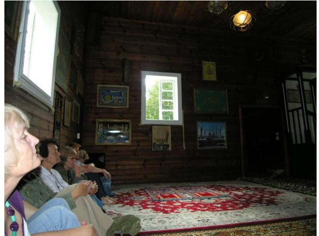
Kruszyniany w środku Meczetu