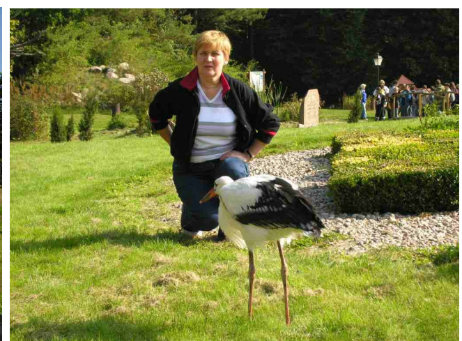
Krynki - Park Megalitów