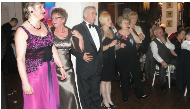
w oczekiwaniu na wyniki