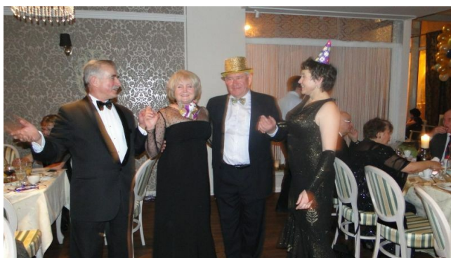
jak się bawić to się bawić