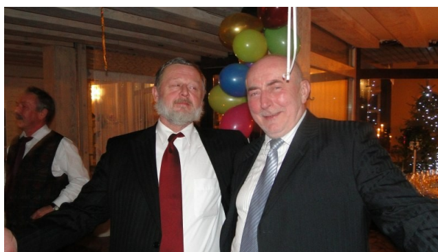
nie ma to jak koledzy z klasy, ustalanie tematu następnego wspólnego wykładu ?