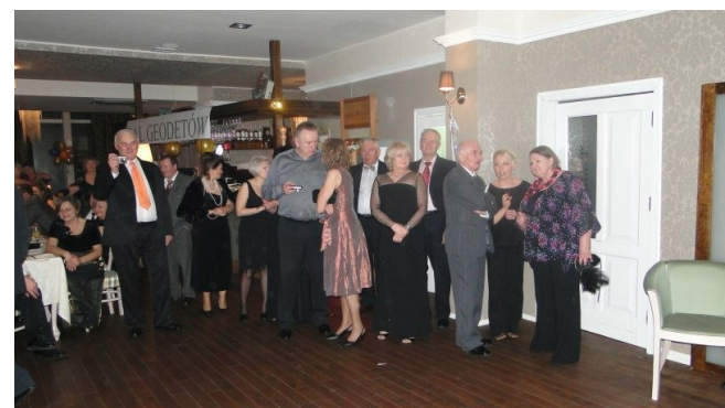
jury obserwuje tańczących.... która para zwycięży?