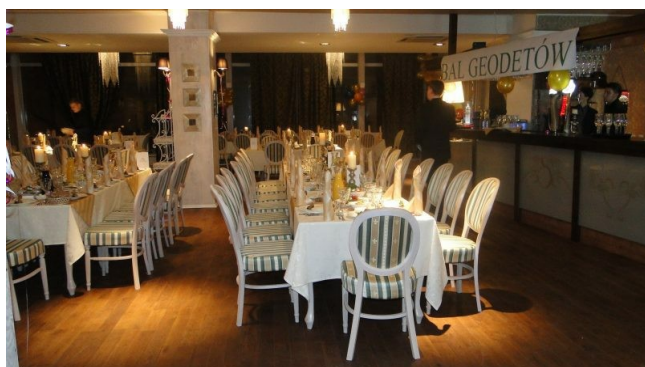
sala w oczekiwaniu na gości

Znajdującej się w Domu Technika w Łodzi, Plac Komuny Paryskiej 5a W balu wzięło udział 82 osoby. Wszyscy byli bardzo zadowoleni. Jedna niedoszła uczestniczka i współorganizatorka złamała nogę i tylko myślami z nami się bawiła .