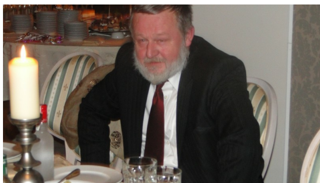
podumać też trzeba