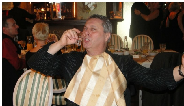
...STO LAT, STO LAT.... ...NIECH ŻYJE GEODEZJA..... za rok znowu się spotkamy??