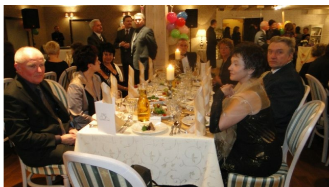
jeszcze momencik ...i zaczynamy