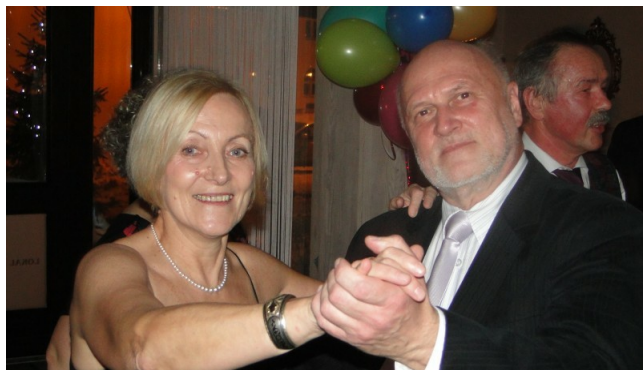
ach, jak przyjemnie