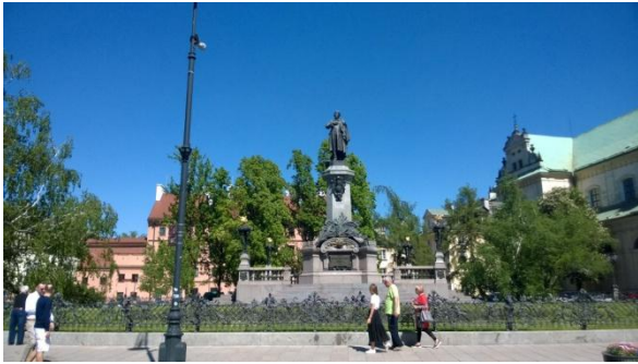
Pomnik Adama Mickiewicza (obok Belwederu)