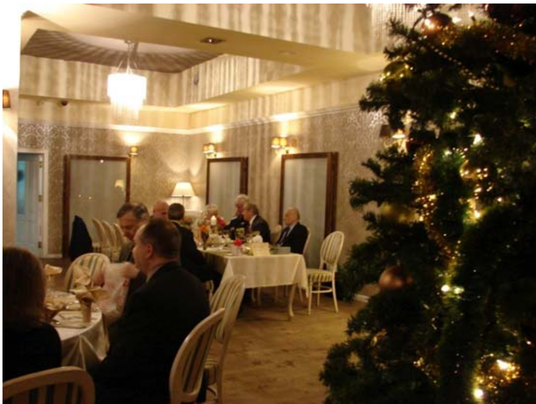
Restauracja „Satyna”. Uroczysta wspólna kolacja członków Łódzkiego Oddziału SGP i zaproszonych gości, na zakończenie obchodów jubileuszu 70-lecia połączonego ze spotkaniem noworocznym.

Po wyjątkowej stravie dla ducha, dalsza część uroczystości jubileuszowej odbyła się w pobliskiej restauracji. Podczas poczęstunku i prowadzonych koleżeńskich rozmów, tradycyjnie, jak na każdym okolicznościowym spotkaniu członków, odśpiewano hymn geodetów, przy współudziale gości oraz przy akompaniamencie muzycznym naszego kolegi.