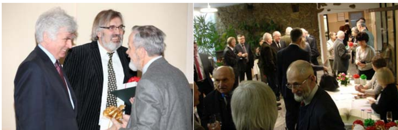
Kularowe rozmowy. Sekretariat uroczystości jubileuszowej.